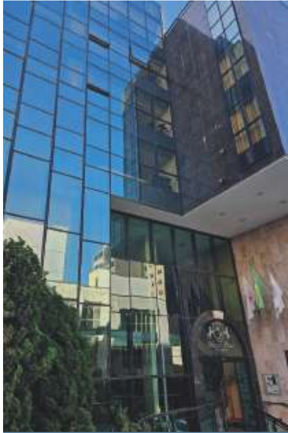
Detalhe, entrada do hotel