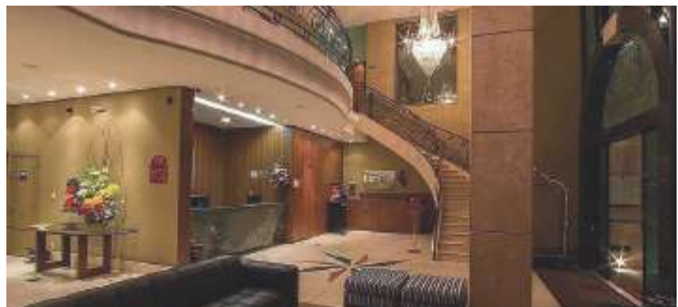
Hall de entrada e recepção