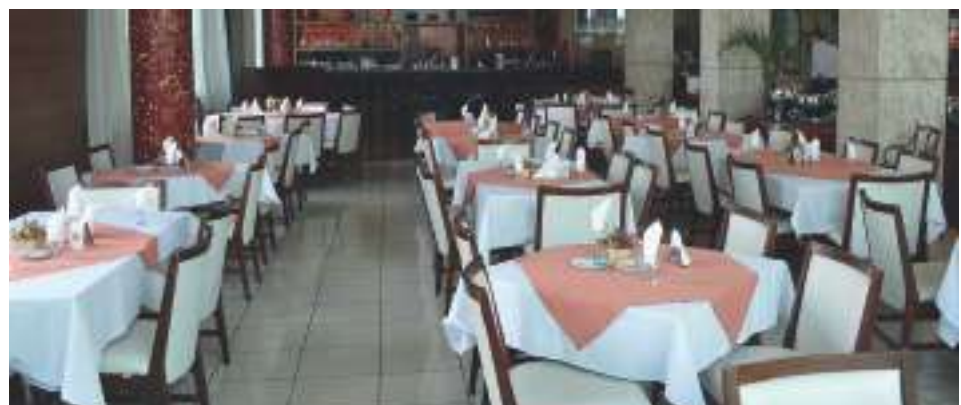
Salão do Restaurante