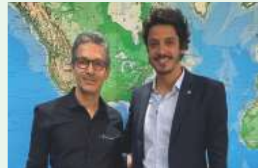
O Governador Romeu Zema enviou o PL 822/23 para apreciação da ALMG

O deputado Doorgal Andrada defende a valorização de todo o funcionalismo público, que, segun-