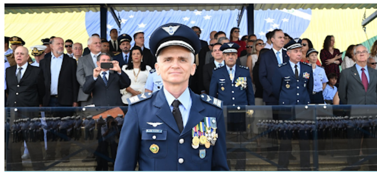
Coronel Aviador Celso Eurico Fleck