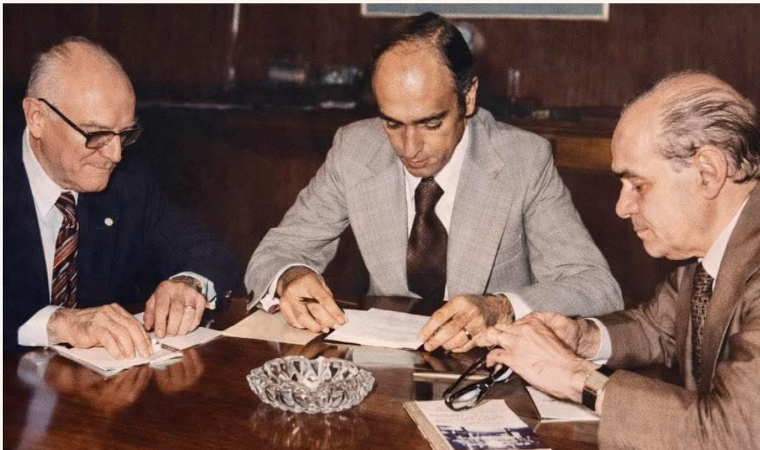
Os líderes da transição democrática: Zezinho Bonifácio, Tancredo Neves e ao centro, o “artífice do consenso”, Marco Maciel. Reprodução.

No Congresso Nacional, dizia-se que ele "falava baixo para ser ouvido por todos". Distante das lideranças expansivas e de retórica exaltada, ele operava com maestria nos bastidores. Sua marca registrada era o binômio: paciência e discrição; era conhecido por ouvir todas as partes de um conflito para, então, articular saídas jurídicas ou políticas que evitassem rupturas institucionais.