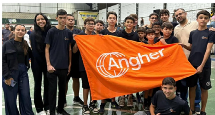
Os Jogos Escolares de Barbacena transcorreram com sucesso e teve participação recorde de equipes.