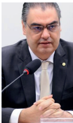
Deputado federal Lafayette de Andrada

O parlamentar foi reconhecido na categoria “Especialistas”, que destaca deputados e senadores com profundo conhecimento técnico em áreas como direito, infraestrutura e economia,