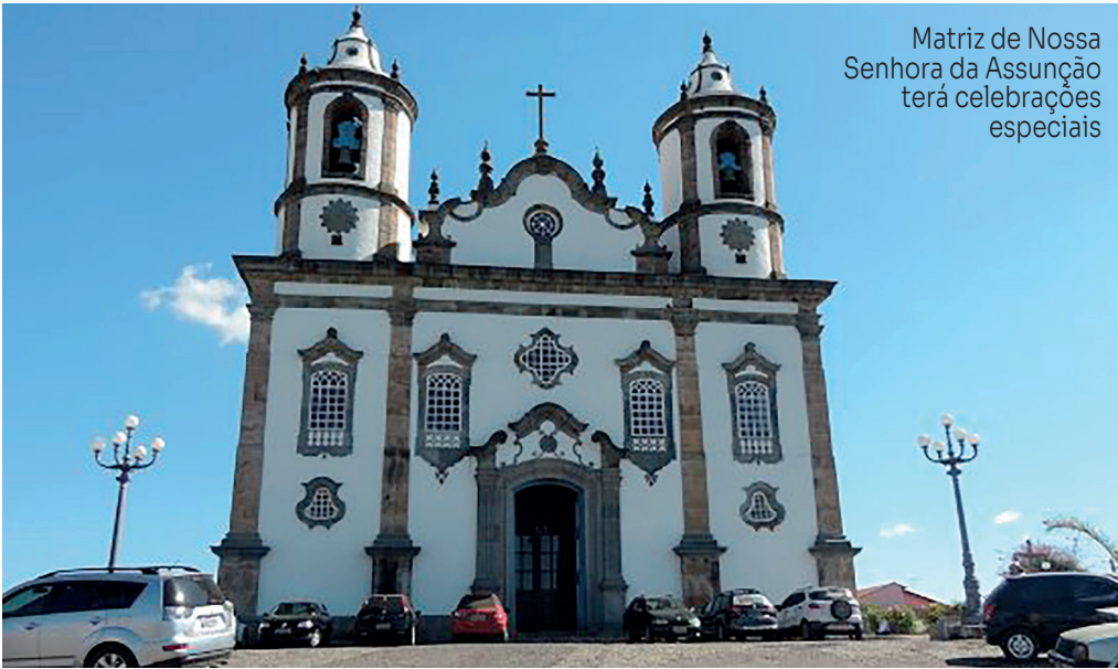
Matriz de Nossa Senhora da Assunção terá celebrações especiais

Neste domingo, 2 de novembro, Barbacena se une às tradições católicas para celebrar o Dia de Finados, data marcada pela memória, respeito e homenagem aos entes queridos que já partiram.