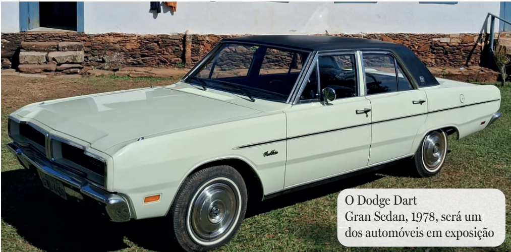
O Dodge Dart Gran Sedan, 1978, será um dos automóveis em exposição

A cidade de Barbacena se prepara para acelerar rumo à inovação e à nostalgia automotiva! Nos dias 15 e 16 de novembro de 2025, em celebração aos seus 80 anos, o tradicional Automóvel Clube de Barbacena será palco do Salão do Automóvel Antigo 2025, um evento que promete reunir apaixonados por carros antigos e cultura auto-