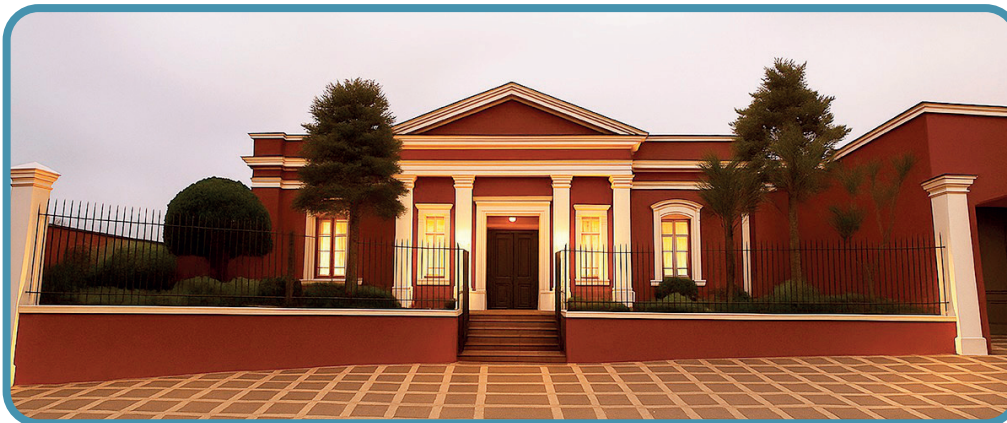
O evento acontecerá no Automóvel Clube de Barbacena