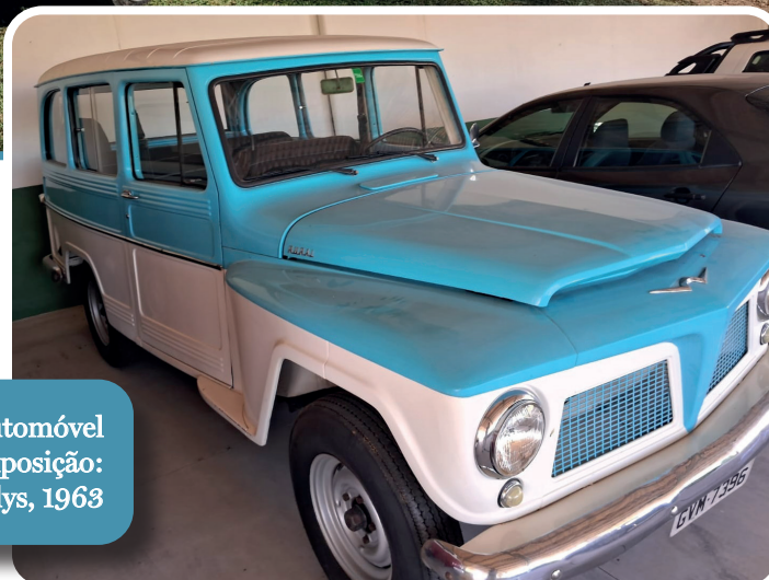
Outro automóvel em exposição: Rural Willys, 1963