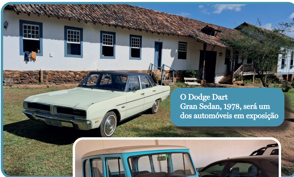
O Dodge Dart Gran Sedan, 1978, será um dos automóveis em exposição