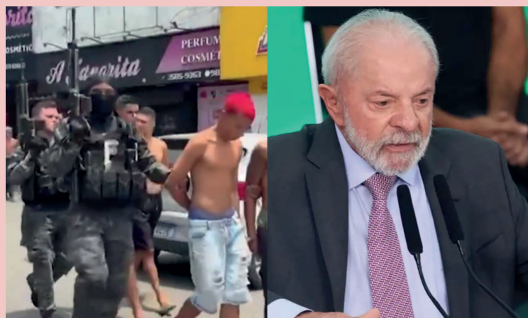
Governo do petista sofre críticas por não priorizar segurança pública

Foram ouvidas 2.020 pessoas em todo o país entre os dias 21 e 24 de outubro — portanto, antes da realização da operação policial mais letal da história do Rio de Janeiro, na terça-feira (29). A margem de erro é de 2,2 pontos percentuais, para mais ou para menos. O nível de confiança é de 95%.