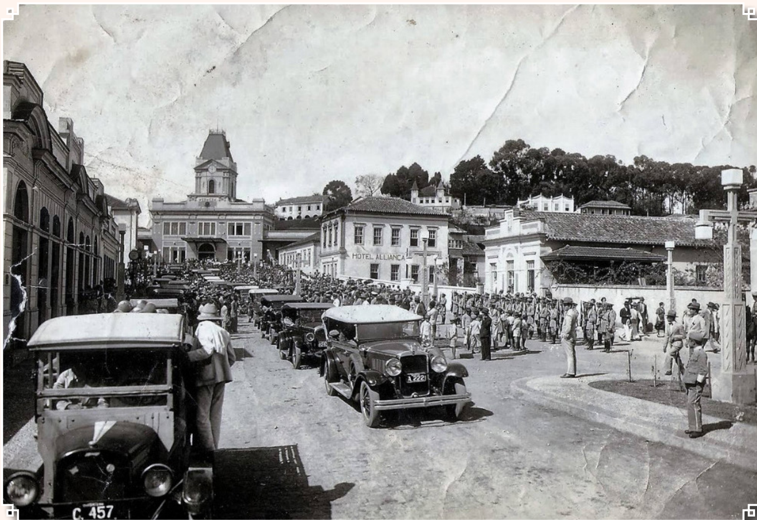
A "Praça João Pessoa," em 1930.