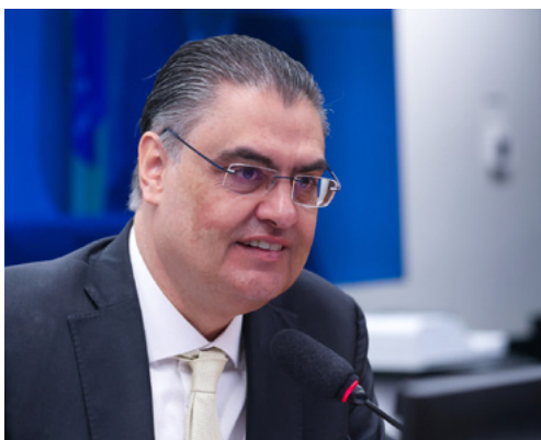
Deputado federal Lafayette de Andrada

O parlamentar criticou a narrativa de que a geração distribuída traria prejuízos às distribuidoras de energia e reforçou que o setor cumpre todas as obrigações legais