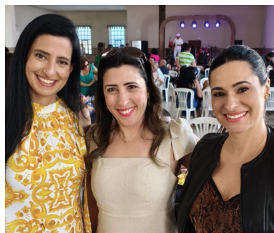
Professoras do Curso de Design de Moda do CTP UNIPAC em almoço festivo no Automóvel Clube