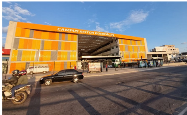
Campus Reitor Bonifácio de Andrada

ca, Ciência da Computação, Ciências Contábeis, Direito, Educação Física, Enfermagem, Engenharia Civil, Farmácia, Fisioterapia, Fonoaudiologia, Medicina Veterinária, Nutrição, Odontologia, Pedagogia, Psicologia, Publicidade e Propaganda e Terapia Ocupacional.