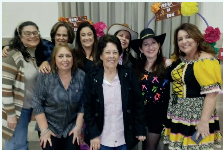
O Arraiá da FAME movimentou o Automóvel Clube