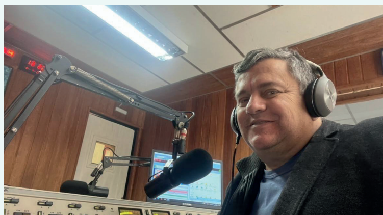
Estou a frente do Programa “Hora do Professor”, de 12:00 horas às 13:00 horas. E do Programa “Show da Tarde”, de 13:00 às 15:00 horas. De Segunda a Sexta na Rádio Correio da Serra... música, esporte e notícia.