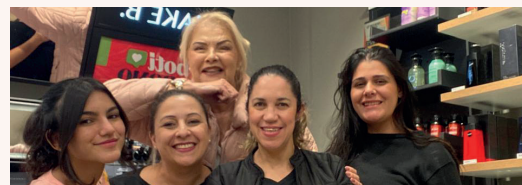
Esta colunista com a equipe dos novos serviços oferecidos pelo Boticário

Visitem e confirmem também as lojas do Boticário na cidade, que além de bonitas e funcionais, estão cheias de novidades como os novos serviços de maquiagem e estética, disponíveis para suas clientes, mediante um simples agendamento. E com a vantagem de que, ao invés de pagarmos, trocamos o serviço por um produto de nossa escolha. Eu já aproveitei a novidade, fazendo uma maquiagem e escolhendo o meu hidratante corporal preferido, o Lily, que amo! Parabéns para o Boticário de Barbacena, pela equipe de profissionais que nos atendem. Simpáticas, gentis e competentes!