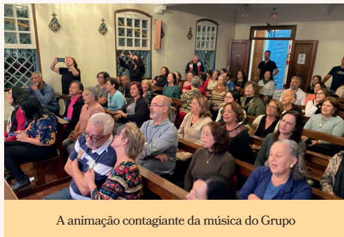
A animação contagiante da música do Grupo